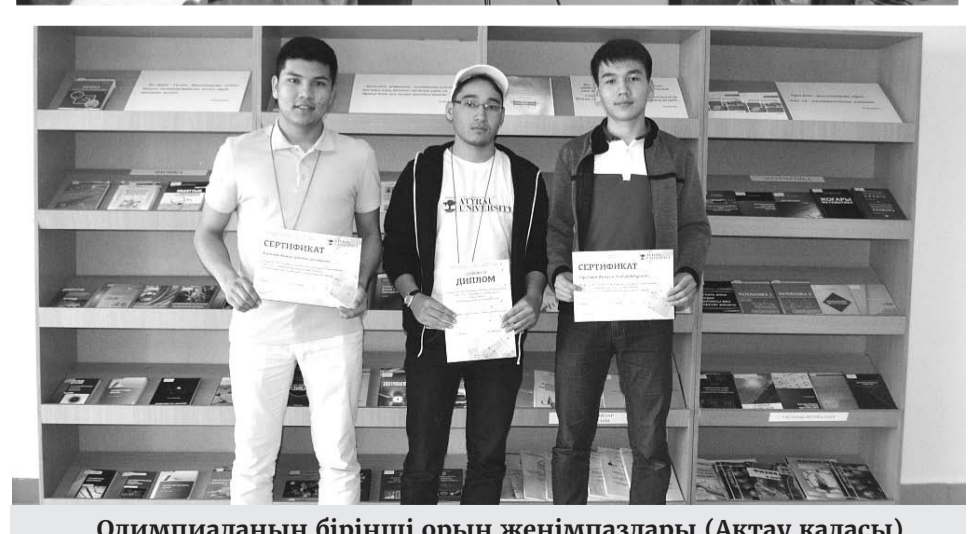
Олимпиаданың бірінші орын жеңімпаздары (Ақтау қаласы)